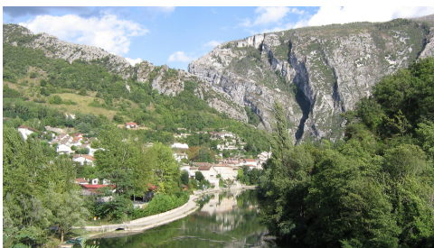
Le Royans, au pied du Vercors