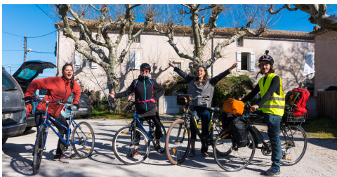
Départ d'Avignon - en forme !