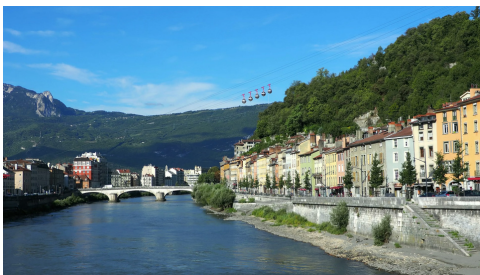
Arrivée à Grenoble - bravo !

Enfin, les voyageurs participent à la vie du camp : courses, cuisine, montage des tentes, forum, hygiène, rangement... en chantant !