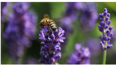
La Drôme provençale